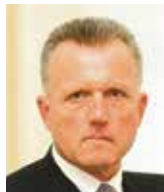
Miroslav Macek bývalý místopředseda vlády ČSFR

Politický „souboj o kraje“ se ve druhé polovině 90. let už vyhrát nedal, přestože eroze České republiky na ambiciózní nepolitické a byrokratické kraje ničemu kloudnému nepomohla.