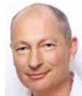
Petr Zimmermann 2000–2008 hejtman Plzeňského kraje za ODS

Dvacetiletá existence stávajících krajů mě nezklamala, neboť jsem s jejich vznikem nespojovala žádná očekávání. Jako každá změna přinesly ztráty i zisky navzdory líbivým prohlášením, které návrhy změn vždy doprovázejí.