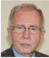
Stanislav Křeček veřejný ochránce práv

Pokud má někdo dojem, že kraje, jak byly ustaveny, se osvědčily, pak takový dojem může mít jen proto, že pokud něco existuje již dlouho a není ani vůle, schopnost ani představa, jak to zrušit, vypadá to, že to tak prostě má být. Od počátku jsem v ČSSD patřil ke kritikům zřizování krajů a nebyl jsem sám. Nakonec ale zvítězila představa, že to povede k posílení strany v těchto zřízených územních jednotkách, což se nakonec do jisté míry a na přechodnou dobu i potvrdilo.