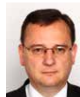
Petr Nečas bývalý premiér ČR

Smysl krajů se z těchto důvodů dodnes nepodařilo plně obhájit. Jejich samospráva je umělá, jsou neautentickým přerozdělovacím mezičlánkem vsunutým mezi stát a obce. Nahradit původní okresy se plně nepodařilo. Kraje neodpovídají potřebám ani velikostně a mnohdy popírají přirozenou spádovost území. Účelovost a krátkozrakost tvůrců tehdejší nepodařené reformy veřejné správy se nám všem zkrátka nevyplatila.