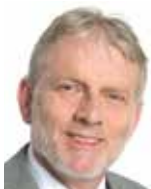
Tomáš Jirsa senátor ODS

Dnes je již jasné, a to jsme na začátku, že budeme rozdělovat život před koronavirem a po koronaviru. Jaký bude život po koronaviru, se zatím lze jen domnívat, ale zasáhne všechny oblasti našeho života, včetně politiky. Vzhledem k přerůstající epidemii strachu a narůstajícího nového „hippies“ období pro určité skupiny obyvatel, bude těžké najít cestu k normálnímu životu i po rozvolnění karanténních podmínek. Epidemii můžeme vzdorovat přirozenými prostředky, ale to při současném psychologickém nastavení lidí a v důsledku prozrazování určitých politických a obchodních zájmů bude již velmi obtížné.