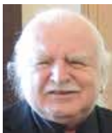
Milan Knížák výtvarník

Krise může být přínosná. Odhalila slabost bruselských úřadů. Hospodářský propad může vést k rušení zbytečných orgánů. Můžeme mít o třetinu členů menší Parlament, méně ministerstev i krajů. To zajistí trvalé úspory. Budeme-li však za čtvrt roku chodit s náhubkem a nedostaneme se na Slovensko či do Vídně, bude to prohra. Ale i za války se dělaly černé zabijačky a pařilo se. Lidská přirozenost se úplně a trvale spoutat nedá. A to je naděje.