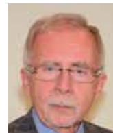
Stanislav Křeček ombudsman

né změny přijmeme, resp. zda jim budeme schopni čelit. Klademe si otázku, zda jim bude schopna čelit naše dnešní politická reprezentace. A zda to vůbec bude chtít dělat? A když ne ona, tak kdo? Ale to už by byly odpovědi na jinou otázku.