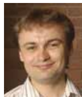
Luboš Motl fyzik