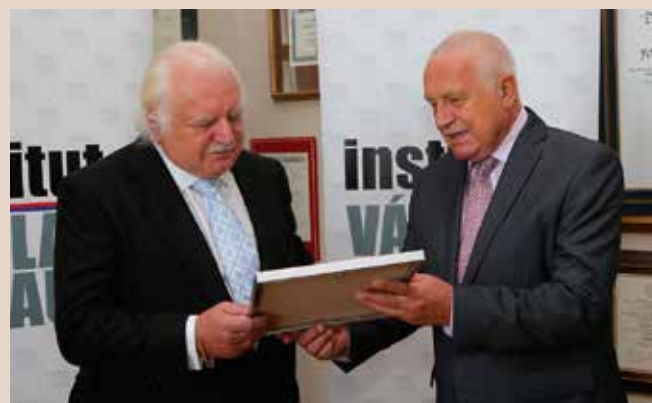
Milan Knížák přebírá z rukou Václava Klause výroční Cenu IVK za rok 2015.