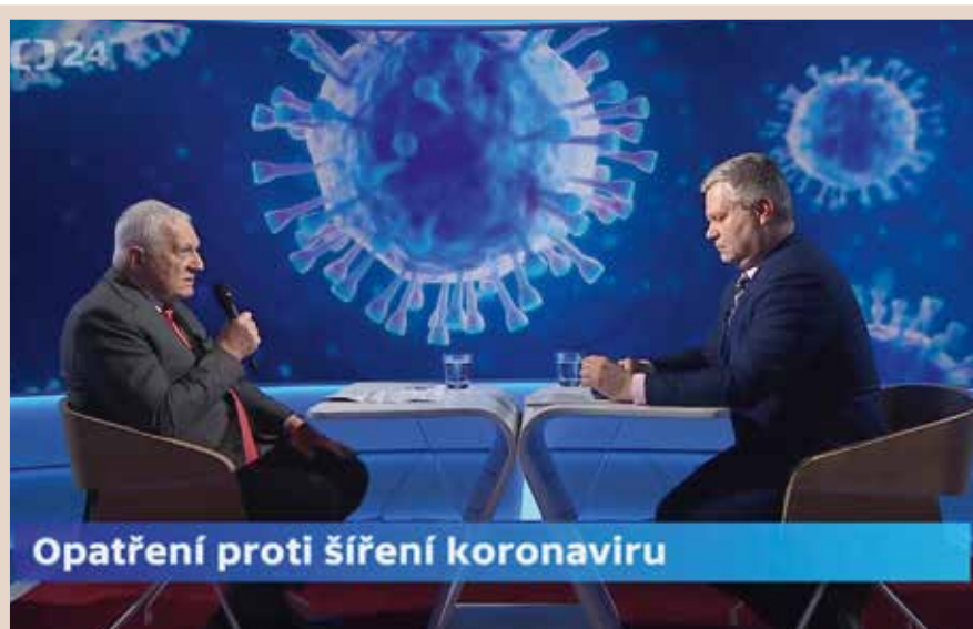
Václav Klaus byl ve čtvrtek dne 12. března 2020 hostem v pořadu České televize – Interview ČT24. Tématem byla současná epidemie koronaviru a její dopady na českou společnost, zdraví a ekonomiku, ale také ohlédnutí se za volbami na Slovensku i situace na řecko-tureckém pomezí.

Já se bojím, že tak jako při každé krizi se zvýší dohled státu nad občanem. My ekonomové mluvíme o efektu západky. Celá řada státních opatření i po krizích zůstává, a nebudou se rušit ani tentokrát. To je naprosto evidentní. Zadrhé rychleji dospějeme k věci, ke kterým se stejně směřovalo, jen by to bez koronaviru trvalo déle. Klasický příklad je útok na hotovost. Tady ▶