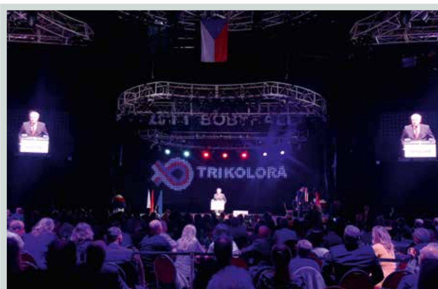
Václav Klaus na ustavujícím sněmu hnutí Trikolóra, Brno, 28. září 2019.

jetí zdánlivě demokratické Evropské unie – zvykli pasivně akceptovat řešení a rozhodnutí, která velmi často byla v konfliktu s naším národním zájmem. To by mělo skončit.