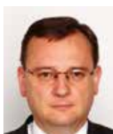
Petr Nečas bývalý premiér ČR

Svoboda, v jejímž jménu se odehrál Listopad 1989, dávno přestala být posvátnou hodnotou. Západ, jak jsme si jej před třiceti lety představovali, se zásadně proměnil a pod jeho vlivem se mění i naše společnost. Svoboda dnes už nikoho fakticky nezajímá. Nahradila ji rovnost, před třiceti lety zprofanovaná komunismem, dnes opět vystrčená moderními levicovými pokroky na piedestal. Málokdo si uvědomuje, že na úkor svobody. Ta je nám denně salámovou metodou po kouskách odebírána pod hesly ochrany těch či oněch menšin, klimatu, zdraví a všemožných dalších libě znějících falešných záminek. Učí nás nedůvěřovat svobodnému jednotlivci a jeho moudrosti, ale spoléhat ve všem na všemocný stát, který nás má chránit před sebou samými a bránit diskriminaci všech všemi. Znovu existuje pouze jediná pokrokařská pravda, jiné názory jsou lži nebo fake news , znovu se šíří cenzura a je vynášena do nebes. Přitom nám stále hysteričtěji vtlokají, že hrozba pro naši svobodu prý přichází z dalekého Východu, a tak se často zmítáme v podivných politických křečích. Bohužel, největší hrozbu pro zbytky naší svobody představují poměry v dnešní Evropě a její vliv na poměry u nás.