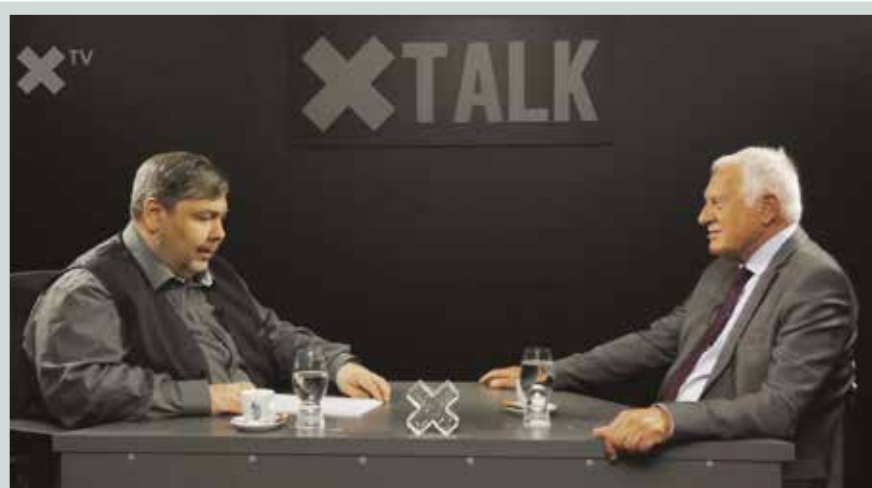
Václav Klaus byl hostem ve vysílání internetové televize XTV moderátora Luboše Xavera Veselého. Video se záznamem rozhovoru naleznete na www.institutvk.cz .