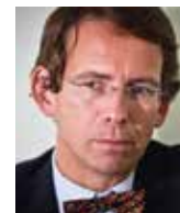
Petr Drulák diplomat a politolog

Vždycky platilo a platí, že o vysokých hodnotách se mluví hlasitě tehdy, když se chce pomlčet o obyčejných zájmech. Je tomu tak i v případě hodnot evropských. Skrývají se za nimi zájmy německé, ale také francouzské a některé další. A ovšem také zájmy těch, kdo by si v případě neexistence hodně košatých bruselských institucí museli hledat jinou práci. Existují studie, které dokládají, jaké problémy musely řešit státy typu Francie v době dekolonizace. Do Paříže se z celého světa nahrnula spousta úředníků, kteří přišli o možnost uplatňovat v koloniích francouzské hodnoty. Vyřešilo se to mimo jiné tím, že se správa decentralizovala a úředníci dostávali místa na úrovni departementů. Pokud by přišli o práci lidé, kteří z Bruselu šíří evropské hodnoty, možná bychom kvůli tomu museli obnovit okresy. Proto buďme rádi, že evropské hodnoty máme. O čem jiném by mluvili politici těch zemí, jejichž skutečné zájmy v Bruselu nikoho moc nezajímají?