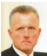
Miroslav Macek spisovatel

Naopak, jak dokázala ve své praxi, jejími prioritami jsou mj. šikana těch členských zemí EU, které důsledně hájí své národní zájmy tam, kde jim orgány EU vnucují opak, (včetně verbálních útoků a urážek občanů zemí V4), potlačování svobody projevu, cenzura sociálních sítí, propagace nebezpečné politiky genderismu prostřednictvím diktátu o podobě zastoupení pohlaví ve vedení soukromých firem a skrze podporu Istanbulské úmluvy, za kterou aktivně lobbuje. To jsou tedy hlavní hodnoty a priority paní Jurové. A pak možná ještě těch 50 000 Kč měsíčně navíc, které získá k dosažitému platu v pozici 8. místopředsedkyně Evropské komise.