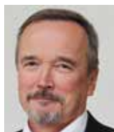
Jiří Kobza poslanec SPD

I tak by se komise při volbě názvů měla držet spíše právní střízlivosti a vyhýbat se pojmům jako evropské hodnoty. Někdo si pod nimi představí obhajobu tradiční rodiny a odmítnutí nekontrolované imigrace, jiný naopak podporu LGBT a otevřenost do všech koutů světa. V politické debatě vedou odkazy na hodnoty obvykle k vylučování domněle „špatných Evropanů“ a evropští úředníci z nich v lepším případě udělají karikaturu. Ale i takto nešťastně pojmenovanému portfoliu lze dát praktickou střízlivost a bránit ho před hodnotovými aktivitami.