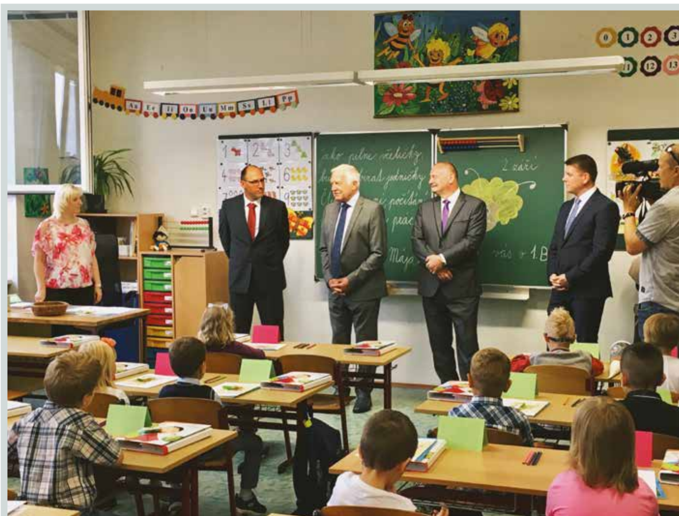
Bývalý prezident České republiky Václav Klaus v pondělí dne 2. září 2019 na půdě 1. ZŠ v Hořovicích tradičně zahájil nový školní rok. Po krátké besedě s prvňáčky a s pedagogickým sborem se na místní radnici setkal s vedením města a následně zavítal do Nemocnice Hořovice. Krátký pobyt v Hořovicích zakončil slavnostním obědem s představiteli veřejného a akademického života regionu a návštěvou farmy a jezdeckého areálu Ranch Hořovice.

Kráceno, plná verze textu viz Literární noviny říjen/2019