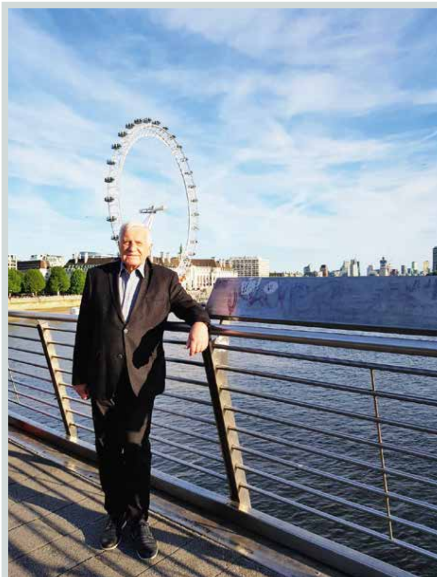
Zápisky Václava Klause z Hillsdale College Cruise si přečtěte na www.institutvk.cz .

To je ostatně i důvodem, proč je ruský systém politicky méně demokratický a více autoritářský, než bychom považovali za přijatelné. Ruská ekonomika se nachází pod viditelnou, a to velmi tvrdou rukou státního intervencionismu mnohem více, než je tomu v našich zemích. Neviditelná ruka trhu je tam potlačena více než u nás. Lidská svoboda je omezena daleko více než v naší části světa, ale přesto platí, že je komunismus v Rusku už dávno minulostí. Ruský sys-