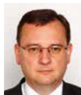
Petr Nečas bývalý premiér ČR

A ještě jeden fenomén letošních evropských voleb nesmíme přehlédnout. Po celé roky byla pěstována chiméra, že evropské volby budou údajně napadeny a zmanipulovány ruskými „zájmy“. Nakonec k jejich napadení skutečně došlo, ale ne „zvenčí“, nýbrž „zevnitř“ EU (Stracheho aféra v Rakousku). Cílem zjevně neměli být pouze rakouští Svobodní, cílem bylo těsně před volbami co nejvíce poškodit celý politický proud, který se hlásí k obhajobě národního státu. I toto je zpráva o dnešním stavu uvnitř EU, kterou nám evropské volby nabídl.