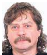
Jan Keller sociolog, europoslanec v letech 2014–2019

Nové síly, které se objevily v unijním „parlamentu“, které usilují o nový typ spolupráce zemí v Evropě, na základě Nové smlouvy, nesmí zapomenout na poučení z May. Nelze uzavírat kompromisy, či se o ně snažit s bruselským – německo/francouzským establishmentem. Rýsuji se koalice lidovců, socialistů a liberálů bude pokračovat v dosavadním kurzu EU s nezměněnou silou. Nové strany musí zesílit tlak především na Evropskou komisi, která je obecně vnímána negativně, ale i další struktury, včetně parlamentu samého. Aktivní blokáce všeho, co půjde, využívání všech procedur k zdržování progresivistické agendy, aktivní mimoparlamentní permanentní nátlak a kampaň s přípravou na národní volby. Národní parlamenty budou pro budoucnost Evropy klíčové, ale aktivní činnost v EP bude důležitou součástí kampaně. Že budou mainstreamem blokovány, je evidentní, proto je třeba hledat alternativní informační kanály. Jednací sály v Bruselu i Štrasburku se musí stát demokratickým bitevním polem o budoucnost Evropy i o ty, kteří dosud váhají, zda dát hlas stranám hlásícím se k národním kořenům a tradičním evropským hodnotám.