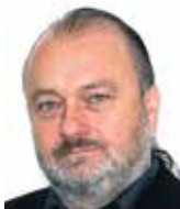
Ladislav Jaki Institut Václava Klause

Prezident Václav Klaus byl hostem pořadu Interview Plus na stanici Český rozhlas Plus a měl to být rozhovor o nadcházejících volbách do Evropského parlamentu. Hned dru-