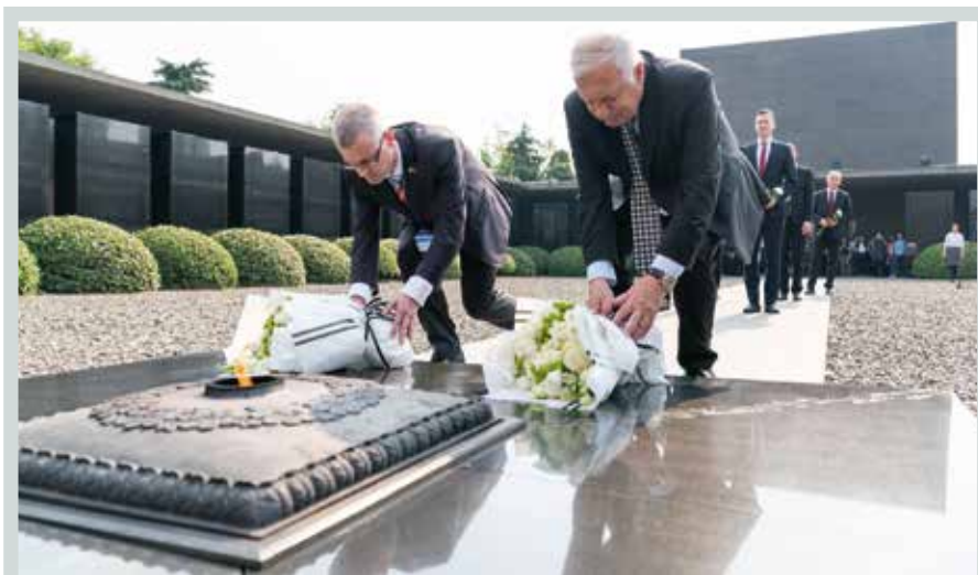
Václav Klaus v polovině května navštívil Čínu. 11. května položil věnce v památníku Nankingského masakru v bývalém hlavním městě Nankingu a zahájil zde koncertní turné České filharmonie. Ve Wuzhenu se od 12. do 13. května zúčastnil mezinárodní konference, kterou pořádala organizace Global Council of the Belt and Road, a vystoupil zde se svým projevem. Projev i zápisky z cesty si můžete přečíst na www.institutvk.cz