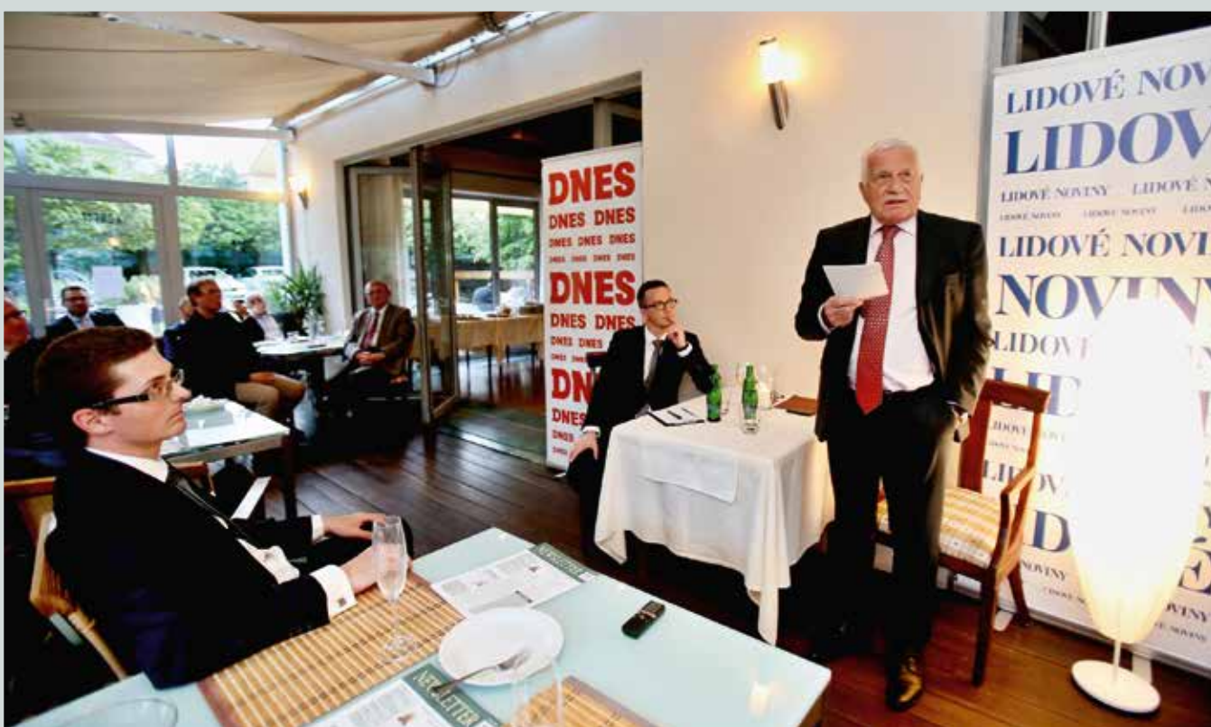
Václav Klaus na diskusním klubu Lidových novin v Brně, 23. května 2019.