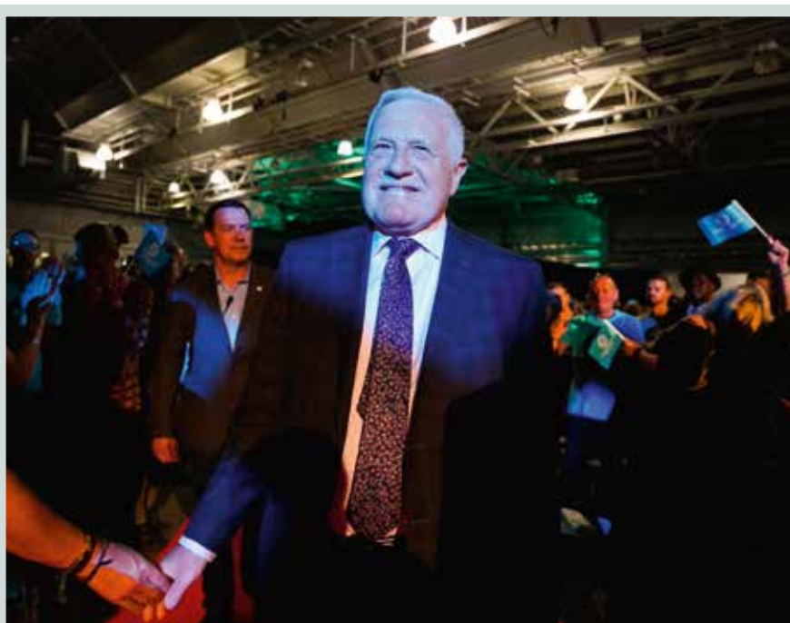
Václav Klaus na předvolebním shromáždění Brexit Party v Londýně. Videozáznam z akce můžete zhlédnout na www.institutvk.cz .

Druhý řečník, to bylo pro všechny skutečné překvapení, které se kupodivu podařilo utajit. Na velkolepé obrazovce se objevil krátký medailonek prezidenta České republiky Václava Klause, kterému dominovaly