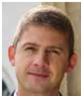
Petr Mach ekonom

V roce 2003 jsem hlasoval pro vstup do EU. Přiznám dokonce i to, že si nejsem jist, jak bych v téže věci hlasoval dnes, neboť by to bylo opět bez onoho bezprostředního a silně frustrujícího zážitku s bruselskou arogancí a zejména pak i nekompetencí. Mluvíme-li ovšem o reálném dnešku, pak tu zkušenost už mám a navíc jsem schopen i analyticky prokázat, že zmíněné charakterové vady evropanství jsou důsledkem jeho stále rostoucího demokratického deficitu. To je i důvod, proč se dnes, co mi síly stačí, všude domáhám bezpodmínečného vystoupení ze spolku, pro který jsem kdysi hlasoval.