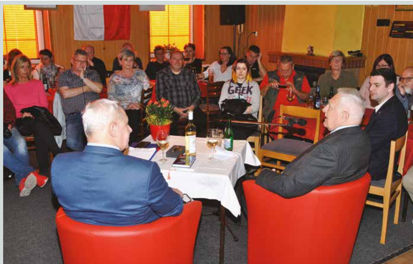
Václav Klaus se ve čtvrtek 11. dubna 2019 zúčastnil velmi přátelského diskusního večera s členy spolku ROTAVAK v Rotavě na Sokolovsku.