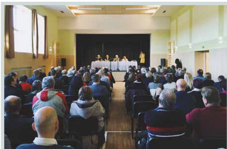
Václav Klaus se na pozvání rodiny Křivinkových ve středu 27. března 2019 zúčastnil jimi organizovaného diskusního večera s občany v sále sokolovny v obci Lípa u Zlína.

(dokončení textu naleznete na www.institutvk.cz )