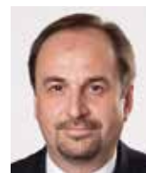
Jan Kohout bývalý ministr zahraničí ČR

Svět tedy pět let po Majdanu není bezpečnější a to, že konflikt nenabyl na intenzitě, je především zásluhou zdrženlivého jednání Vladimíra Putina.