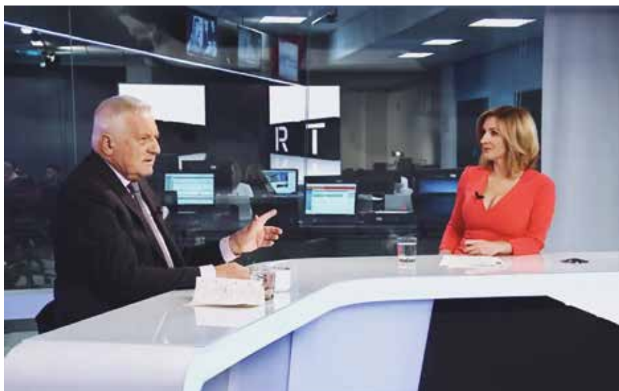
Václav Klaus byl v neděli 6. ledna 2019 tradičním hostem novoročního vysílání pořadu Partie na televizi Prima. Záznam rozhovoru prezidenta Klausovi s moderátorkou Terezií Tománkovou naleznete v archivu pořadu na stránkách televize ( https://prima.iprima.cz/partie/06012019 )