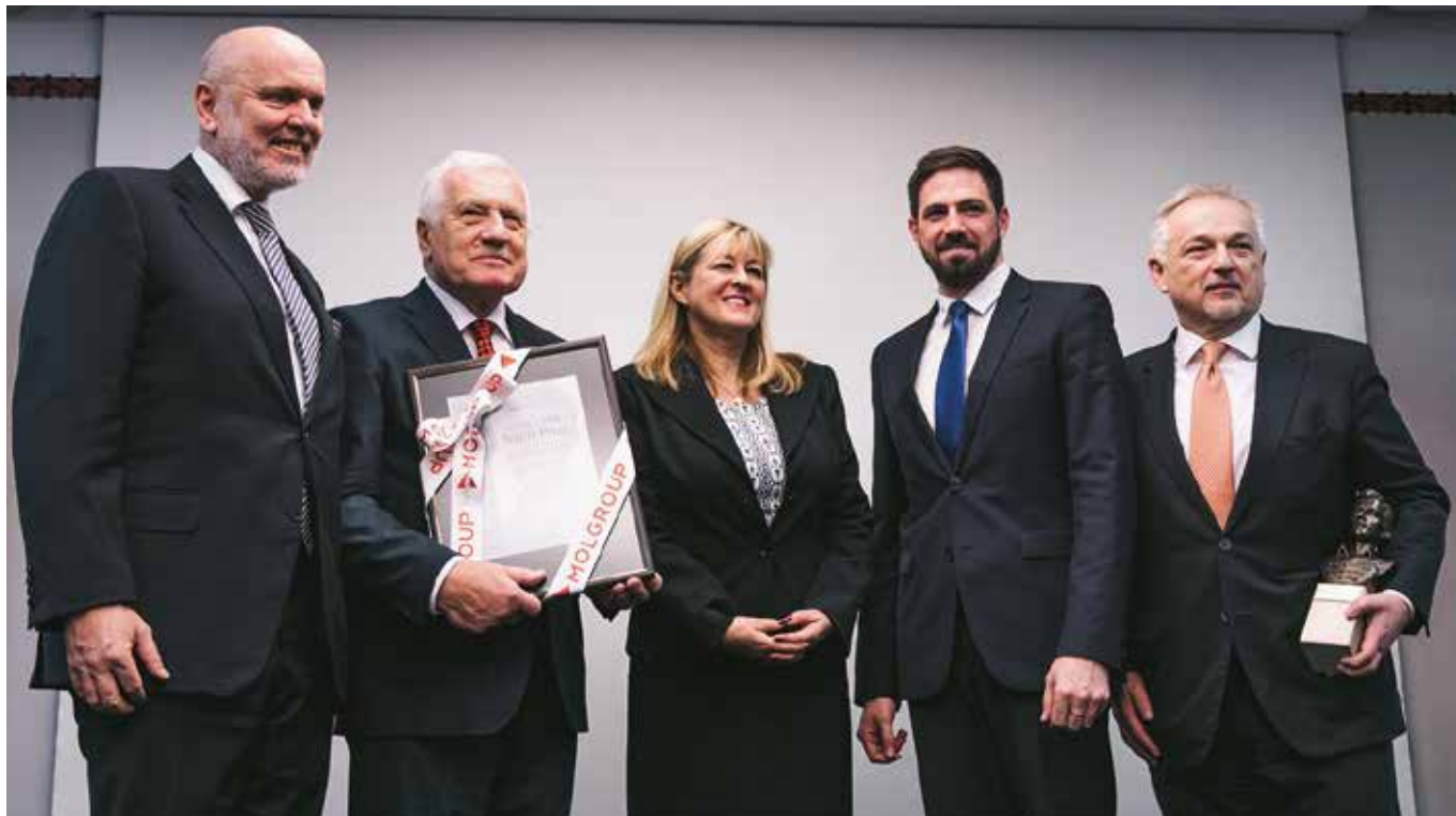
Václav Klaus přebírá Petöfiho cenu, Budapešť 10. 12. 2018

lidí kolem Václava Klause v 90. letech dosáhla, byli to všichni vystupující v Budapešti, kteří naopak tento přínos ocenili s úctou a evidentním respektem. Holt na rčení, že doma není nikdo prorokem, se zase ukázalo kus pravdy.