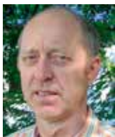
Aleš Valenta a kol. IVK

Alternativa pro Německo (AfD) je od svého vzniku v roce 2013 terčem nenávislných útoků fanatických a stále lépe organizovaných levičáků tzv. Antify. V posledních dvou třech letech jejich agresivita a brutalita zřetelně narostla, evidentně v souvislosti s úspěchy AfD v zemských a spolkových volbách. Bojůvky Antify ničí stranický i soukromý majetek, psychicky zstrašují, skandalizují a v poslední době stále častěji i fyzicky útočí na poslance a další představitele této strany. Děsivým a tragickým vrcholem těchto – hitlerovské Německo připomínajících – extremistických činů je napadení poslance spolkového sněmu a šéfa regionální pobočky AfD v Brémách Franka Magnitze, kterého se tři neznámí útočníci 7. ledna odpoledne pokusili zabít.