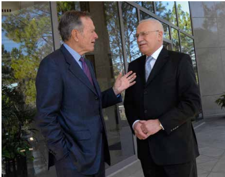
Prezident Václav Klaus s 41. prezidentem USA Georgem H. W. Bushem v jeho prezidentské knihovně v texaském Houstonu (2007)

(ve Washingtonu na pohřbu prezidenta Reagana, v Jeruzalému na pohřbu premiéra Rabina, v Římě na pohřbu papeže Jana Pavla II.). Setkali jsme se např. při zahájení Olympijských her v Athénách v roce 2004 a nikdy nezapomenou na večeri v jeho (od nějakého řeckého magnáta zapůjčené) jachtě v athénské přístavu, kdy si evidentně užíval pozici „older statesman“. Nezapomenutelné pro mne je naprosto náhodné setkání v čínském Pekingu v obří budově Velkého paláce lidu