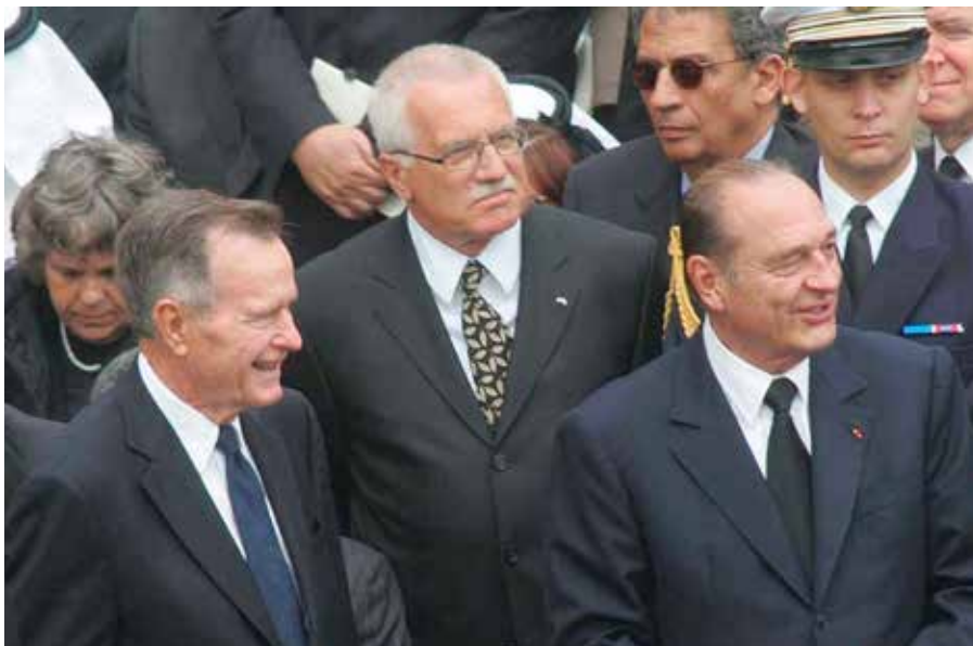
Na pohřbu papeže Jana Pavla II. v Římě v roce 2005 (zleva prezident Bush, Václav Klaus, prezident Chirac)

xaském Houstonu. Tato jeho prezidentská knihovna byla v mnoha ohledech předlohou mé dnešní prezidentské knihovny, kterou je Institut Václava Klause. Ve svých „Zápiscích z jihu USA“ jsem 6. března 2007 napsal tyto věty: V jižanském Houstonu už je jaro. Teploměr ukazuje více než 20° C, všude jsou barevné květiny nám známých i neznámých tvarů, v umělém jezírku pod okny post-prezidentské kanceláře George Bushe staršího se na kamenech vyhřívají želvy. Největším zážitkem bylo setkání s prezidentem Bushem, který si plně, ale velmi pracovně užívá své postprezidentování. Dokonale se mu daří tuto roli hrát. Má na to úřad, skoro se všemi rekvizitami prezidentského úřadu, má na to nadhled, rozhled, klid v duši. Dívá se na věci s dlouhodobějším pohledem, přemýšlí, poslouchá, vidí spíše trendy a tendence než poslední události, srovnává Čínu, kdy tam byl v 70.tých letech velvyslancem, s Čínou dnes, Rusko, když byl šéfem CIA, s Ruskem dnes, těší se, že Sarkozy, vyhraje-li, ubere z francouzského antiamerikanismu, vzpomíná na návštěvy Prahy, i na to, jak mluvil k plnému Václavskému náměstí. Nesmírně milá a přátelská schůzka – jako ostatně všechny předchozí – se z plánované půlhodiny protáhla na trojnásobek. Mne má docela rád. Novinářům řekl: „Jsem velmi potěšen, že tu prezident Klaus uvidí, hodně jsem se od něj dozvěděl o Evropě i o dalších věcech. Známe se už dlouho a stále mne udivuje svou silou i vůdcovskými schopnostmi,