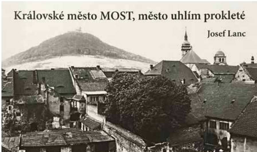
Josef Lanc „Královské město Most, město uhlím prokleté“ (Bohemia film, a.s., 2018)