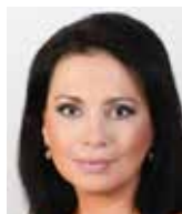
Jana Bobošíková bývalá poslankyně Evropského parlamentu

Istanbulskou úmluvu (IÚ) považují pro ČR za zbytečnou a škodlivou. Může přinést trestní represe, zvýšení výdajů, zvýšení administrativy a posílení pravomocí neziskových organizací.