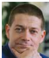
Patrik Nacher poslanec hnutí ANO

To není strašení, to je dnešní realita v Evropě. Kdo chce skutečně hájit lidská práva, musí se razantně takovýmto totalitním praktikám postavit. Včetně ratifikace Istanbulske úmluvy.