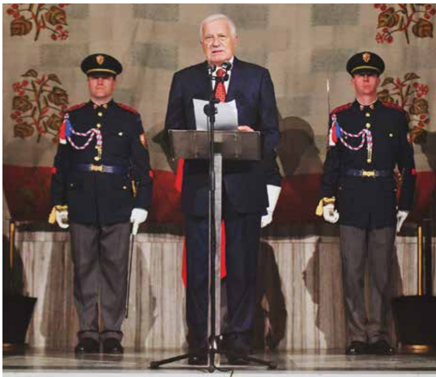
Václav Klaus pronášející svůj projev k státnímu svátku České republiky (Vítkov, 28. října 2018). Projev a další texty k výročí si můžete přečíst v nové publikaci IVK – 100 let od založení Československa.

Nynější kulturní války ve Spojených státech o americký kosmologický názor budou probíhány až do konce, jako podobné konflikty v minulosti, které „nemusejí být nutně krvavé, ale vyvolávají ostré postoje, vedoucí k nenávisným volebním zápasům“ (Gingrich, s. 17). Pokud si uvědomíme americkou „soft power“ (když Amerika kýchne, zbytek světa dostane rýmu), je zřejmé, že výsledek těchto kulturních válek ovlivní také kosmologický názor většiny světa. ■