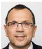
Jaroslav Foldyna poslanec ČSSD

Pokud bude IÚ přijata, dojde k likvidaci principu rovnosti občanů před zákonem, k diskriminaci na základě pohlaví, k další destrukci partnerských, manželských a rodinných vztahů, k dalšímu zestátnění soukromí, rodiny a výchovy dětí. Dojde k posílení moci neziskových organizací a ke stavu, kdy partnerské, manželské a rodičovské vztahy v ČR bude posuzovat mocný nadnárodní orgán, ve kterém ČR nemá smluvně garantované zastoupení a ve kterém mohou mít většinu státy se zcela jiným hodnotovým rámcem.