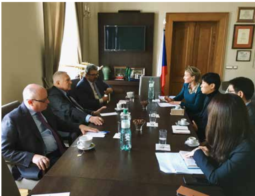
IVK v listopadu navštívila delegace jihokorejského Ministerstva sjednocení, která v souvislosti s probíhajícími změnami na Korejském poloostrově měla zájem vyslechnout si české zkušenosti z období pádu komunismu, obnovení demokracie a ekonomické transformace. (15. listopadu 2018)

Úmluva by povzbudila šíření atmosféry udavačství a strachu. Hrozilo by nařízené prolomení lékařské a advokátní mlčenlivosti.