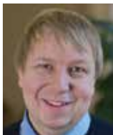
Aleš Juchelka poslanec hnutí ANO

Na úvod je potřeba říci, že všichni, ať už zastánci, nebo odpůrci Istanbulské úmluvy (IÚ), jsou proti jakémukoliv násilí, to domácí nevyjímá. Postihovat domácí násilí a pomáhat jeho obětem je to, co nás spojuje. Padlo to i na mém semináři v Poslanecké sněmovně a všichni se na tom shodli.