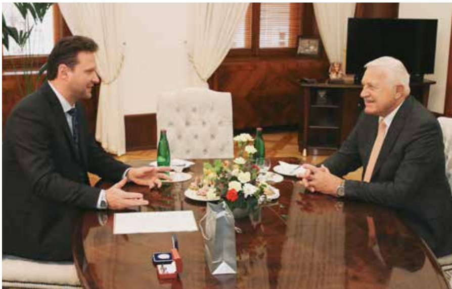
Václav Klaus navštívil v pátek 2. listopadu 2018 po osmi letech Poslaneckou sněmovnu Parlamentu ČR a setkal se s jejím předsedou Radkem Vondráčkem.

Přijetí IÚ znamená její nadřazení českému právu, což se málo zdůrazňuje. Násilí na občanech, včetně domácího, pomoc jeho obětem i prevence jsou dostatečně upraveny stávající legislativou. Pokud jde o postavení žen v Evropě, volební právo měly české ženy o desítky let dříve, než ženy ve Francii, Itálii, Belgii nebo v Portugalsku. IÚ pod rouškou potírání násilí na ženách tlačí na změnu základního hodnotového rámce současné české společnosti. Přijetí IÚ nabourává minimální hodnotový a institucionální konsensus, ze kterého vychází české zákonodárství se všemi důsledky, včetně eroze hodnotového a spravedlnostního ukotvení.