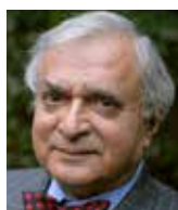
Deepak Lal ekonom

V několika posledních měsících jsem pobýval ve Spojených státech a Velké Británii, přičemž jsem tyto země nikdy neviděl na individuální úrovni tak rozpolcené jako dnes. V Británii je příčinou rostoucího nepřátelství mezi přáteli a v rodinách brexit. Jakmile se na nedávné večeri dlouholetých přátel diskuse stočila k tomuto tématu, vedlo to k vášnivě diskusi, při níž se nakonec hostitelé pustili do hostů, kteří patřili ke stoupencům brexitu, a vyzvali je, aby odešli a už s nimi nikdy nepromluvili. Jeden prominentní historik, zastánce setrvání Británie v EU, má v okně svého domu cedulku s nápisem „Stoupenci brexitu nejsou vítáni“. Podobně je nemožné na večírcích na obou pobřežích Spojených států mezi dlouholetými přáteli – ve vsi zdvořilosti – hájit Donalda Trumpa. To už nejsou pouhé střety osobní identity, jak tvrdili mnozí politologové včetně Francise Fukuyamy, protože tito přátelé se šťastně szili se svými rozdílnými identitami, aniž docházelo k rozepřím. Jedná se o konflikty, které se více podobají evropským náboženským válkám v období reformace. Proto jsem si, pokud jde o sociální styk, vzal k srdci moudrou radu královny Alžběty I., že nechce otevřít „okna do lidských duší“, a zakázal si diskuse o panu Trumpovi či brexitu.