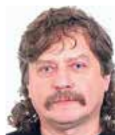
Jan Keller europoslanec za ČSSD

Učím na vysoké škole, diskutuji na právnických i jiných setkáních, neustále mluvím s lidmi všech sociálních rolí i profesí a cítím, že veřejnost je národnímu citění jednoznačně nakloněna. Věřím proto, že „vláda věcí tvých k tobě se opět navrátí, ó, lide český“, byť současně nevyklučují, že navrácení bude spojeno se zánikem či zásadní přestavbou Evropské unie.