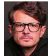
David Zábranský spisovatel a dramatik

Nicméně fakt, že je třeba českou státnost neustále a neúnavně hájit, je naprosto zřejmý, a to právě v souvislosti s naším členstvím v EU. Jsem přesvědčen o tom, že česká státnost má svou budoucnost, jaká ale bude, závisí především na nás, na našich dětech i dalších generacích a jejich ochotě postavit se v boji za další uspořádání evropských poměrů na stranu národních států.