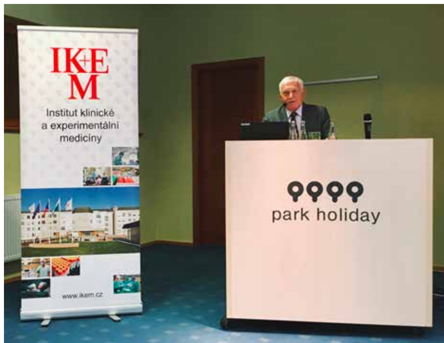
Václav Klaus na konferenci IKEM, 11. října 2018. Projev Václava Klause „Perspektivy Evropy nacházející se v područí Evropské unie“ si přečtěte na www.institutvk.cz