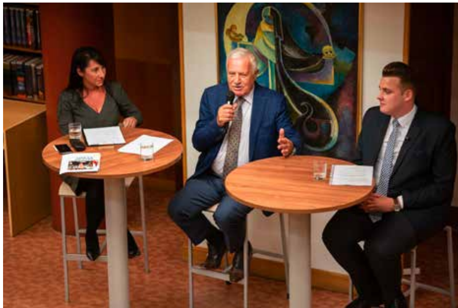
Václav Klaus přijal pozvání plzeňských Mladých konzervativců a vystoupil na jimi organizované besedě ve Studijní a vědecké knihovně Plzeňského kraje (16. října 2018). Více o akci viz text Ivo Strejčka dostupný na webových stránkách IVK.

Státnost malých národů je všeobecně vedle jejich mocných a často agresivních souse-