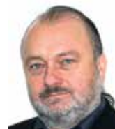
Ladislav Jaki Institut Václava Klause

gencí příjmů k nejvyspělejší zemím Unie (danou odlivem důchodů, dividend), dále efekty „drobných“ mikroekonomických nadaňových regulací, které v posledních letech v ekonomice dominují, jakož i debatu nad tím, jak velká část hospodářské politiky je (má být) mimo politický proces (od finančního dohledu ČNB, přes nejrůznější nezávislé regulační úřady až po vznik rozpočtové rady). V měnové politice zůstávají tématem dlouhodobé efekty tzv. kurzového závazku.