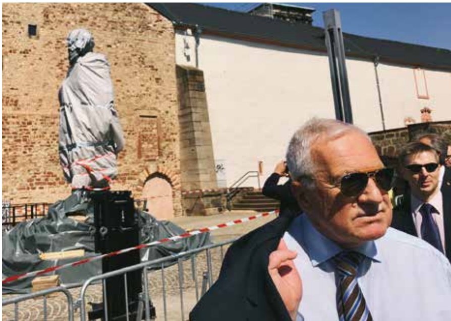
Václav Klaus v Trevíru, 4. dubna 2018. Zápisky z cesty Václava Klause – Za Marxem do jeho rodného Trevíru – najdete na www.institutvk.cz v sekci ostatní texty.

Je známá jeho aktivistická a intelektuální burčující teze, že myslitelé nesmějí svět pouze vykládat, ale že ho musí i měnit. To se mu skutečně podařilo. Komunistické diktatury dvacátého století od Marxe oddělit nelze, jakkoli by si to jeho dnešní stoupenci tolik přáli.