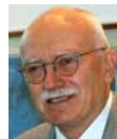
Karel Dyba bývalý ministr hospodářství

Druhá rovina je rovina expertů. Ti jsou naopak ponořeni do svých hlubokých a složitých myšlenek, úvah a nejasných závěrů, které ale neumí ani komunikovat a šířit dál. Možná ani nechtějí, protože pohrdají „aplikovaným“ výzkumem. Mezi experty a realitou se mnohdy rozevírá tak hluboká propast, že vznikají dva oddělené světy: svět každodenního businessu a svět teoretického výzkumu. Přitom by si oba světy mohly být vzájemně velmi prospěšné. Museli by si ale naslouchat.