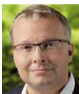
Tomáš Chalupa bývalý ministr životního prostředí

Rozhodne – jako vždycky – mlčící většina. Mám bohužel strach, že se ze svého mlčení (a pohodlnosti) nenechá vyvést. Nejsem optimistou.