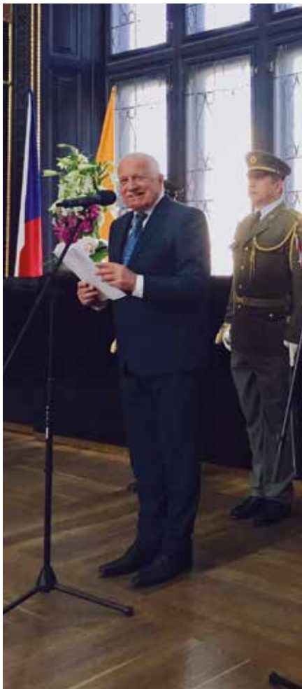
Václav Klaus na Staroměstské radnici

Pokoušejme se o něco jiného. Dívejme se dopředu. Všimějme si, že se z nacistických zločinů jejich neustálým politicky korektním omíláním téměř vytratil jejich skutečný obsah. Nepetržitě opakovanými televizními kvazi-dokumenty skuteční pachatelé těchto zločinů kamsi zmizeli, zbyl pouze všudypřítomný Hitler, který jakoby sňal všechny hříchy Německa a Němců. To nesmíme dopustit. Příčin bylo daleko více, a proto je i poučení z tohoto období daleko větší.