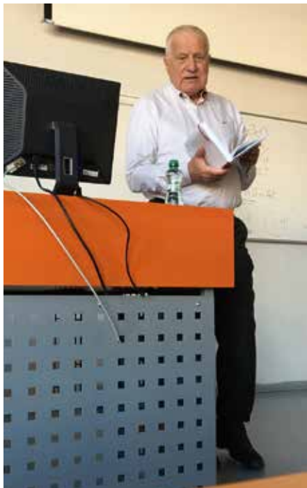
Z výuky Václava Klause na VŠE

Naší věčnou povinností je však tento boj nevzdávat. ■