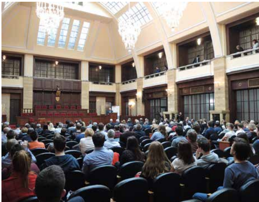
Z bratislavské přednášky na Komenského univerzitě 23. března 2017.