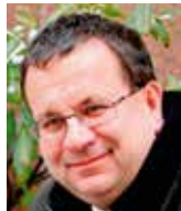
Jan Mládek poslanec ČSSD

opomenutí dopadů na refinancování již dříve poskytnutých úvěrů. Spotřebitelé mohou být při reflexi úrokové sazby nuceni akceptovat nevýhodnou nabídku úrokové sazby od svého stávajícího poskytovatele úvěru, protože z důvodu změny poměrů (např. pokles příjmů, změna rodinné situace, snížení hodnoty zastavené nemovitosti) nebudou splňovat závazné limity a nebudou moci poptávat nabídku na výhodnější úrokovou sazbu u konkurence.