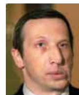
Václav Klaus ml.

Z vystoupení v pořadu Den podle... na ČRo Plus, 9. 11. 2016