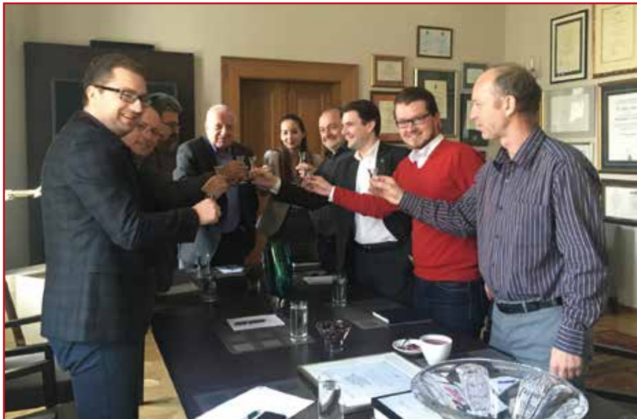
Přítelství IVK na vítězství Donalda Trumpa (9. 11. 2016)

Z odpovědi na otázku zájmového Newsletteru IVK, zda je Trump šancí na změnu americké politiky, 21. 9. 2016