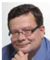
Alexandr Vondra bývalý vicepremiér pro evropské záležitosti

Na české kališníky navázala záhy další protestantská hnutí, nemá cenu tu jmenovat všechna. Monopol katolické církve na víru se zhroutil. Stejně budou po brexitu následovat další národní „exity“ a záhy se zhroutí monopol Bruselu na výklad jediného a politicky korektního evropského pohledu na život. Evropská „víra“ tím samozřejmě nezanikne, jen se musí změnit. A je jen na Evropanech, zda se vrátí k hodnotám křesťanství, liberální či jiné demokracie, totalité anebo přijme korán.