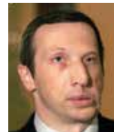
Václav Klaus ml.

S ohledem na obtížnou situaci Unie (těžké hospodářské potíže jižního křídla, imigrace, terorismus, turecká otázka) bude její připravenost ke kompromisům patrně větší, než se může zdát z dosavadních výroků jejích činitelů.