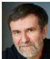
Vlastimil Vondruška historik a spisovatel

Jako na každou historickou událost můžeme se i na brexit dívat buď z hlediska bezprostředního dopadu, anebo z dlouhodobého horizontu vývoje společnosti. Bezprostřední dopady jsou zřejmé. Jenže nejsem ekonom, a proto se k těm ekonomickým nevyjadřuji. Další nezpochybnitelný dopad je politický, ale k tomu se pro změnu vyjadřuje kdekdo.