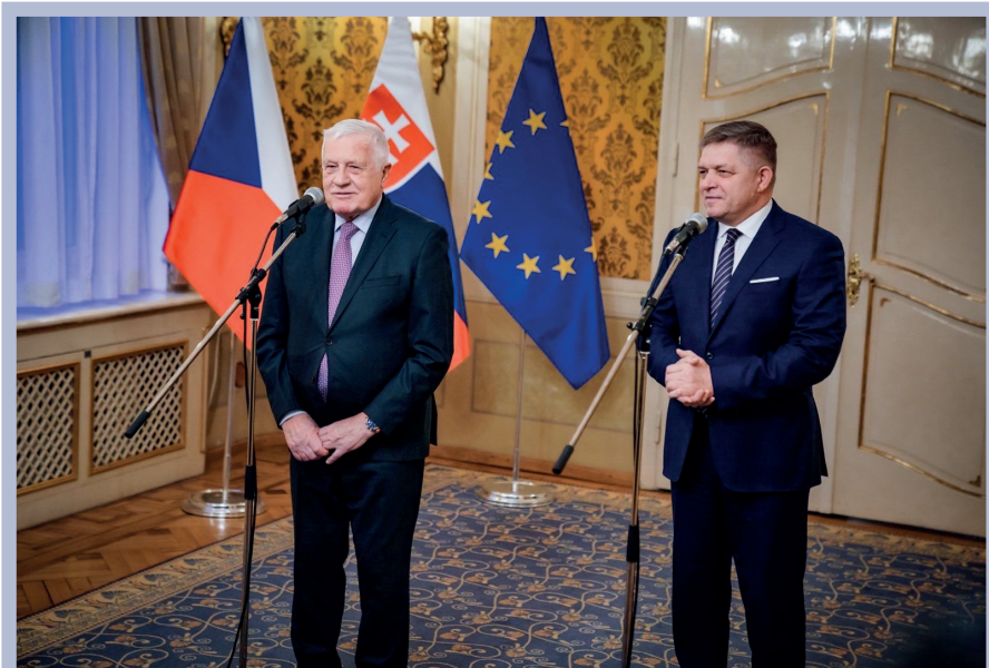
Václav Klaus při setkání se slovenským premiérem Robertem Ficem, 11. 3. 2024

včas zatahnout ruční brzdu, aby sa nezapojili do vojny na Ukrajine takým spôsobom, ktorý by nevyhnutne viedol k tretej svetovej vojne. Slovíčko obavy asi najviac vystihuje náladu viacerých z tejto časti diskusie.