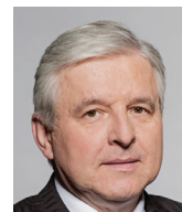
Jiří Rusnok bývalý guvernér ČNB a bývalý premiér ČR

tak plánované škrtky na výdajové straně jsou z nemalé části pouze marketingovým trikem, kterým se ministři snaží vytvořit dojem úspor. Proto si pevně stojím za tím, že se jedná o antiozdravný balíček.