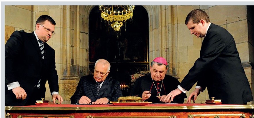
Prezident Václav Klaus a arcibiskup Dominik Duka při podpisu Slavnostního prohlášení o úpravě vzájemných vztahů při péči o Katedrálu sv. Víta, 24. 5. 2010.

pana kardinála Duku s jeho předchůdcem i následovníkem, nebudu diskutovat Dukovo místo v současné církvi a jejích sporech. Nepřisluší mi to, nemám na to potřebné znalosti (a už vůbec ne mandát). A navíc, kdybych pana kardinála v některé z těchto