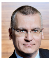
Marek Mora viceguvernér ČNB

Domnívám se, že v dnešní politické konstelaci u nás i v západním světě je inflace velmi obtížně odstranitelná. Permanentní volební kampaň a populistický charakter současné podoby politické demokracie vylučují odpovědnou hospodářskou politiku a prosaditelnost nepopulárních opatření. Enormní zadlužení vlád a v mnoha zemích i domácností vytváří tlak na trvale expanzivní měnovou politiku a tiskění peněz. Dlužníci na inflaci vydělávají a dnes žijeme v éře dluhů. Takže reálný zájem na rychlém potlačení inflace u rozhodujících tvůrců hospodářské politiky postrádám. V českém případě mé pochybnosti plynou z hluboce zakořeněné tradice procyklické měnové politiky, která se na akumulování inflačních tlaků v české ekonomice velmi podepsala. Nebezpečí stagflace, tj. výraznému poklesu růstu při vysoké inflaci považuji u nás za velmi reálnou.