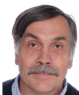
Vladimír Wagner jaderný fyzik

Vývoj energetické situace a přístupů v Evropě, snaha odejít od uhlí, nekončící diskuze o stavbě V. bloku v Dukovanech ale i nejasnosti okolo úspor energií mě vedou k přesvědčení, že ČR čeká velmi zásadní diskuze o Energetické koncepci ČR na příštích 10–20 let. Bez komplexního rozboru situace a návrhu postupů i s ohledem na rozvoj ekonomiky se dále nedostaneme. Čímž vyjadřuji názor, že Vrbětice s budoucností české energetiky souvisí minimálně.