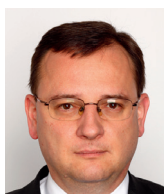
Petr Nečas bývalý premiér ČR

„Vrbětická hysterie“ jako symbol české politické hlouposti a krátkozrakosti pro mě v důsledku znamenají postupný konec české jaderné energetiky a dokončení německého ovládnutí středoevropského prostoru.