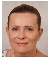
Alena Vitásková Institut Aleny Vitáskové, bývalá předsedkyně Energetického regulačního úřadu

Ta si to přitom opravdu nezaslouží. A především si to nezaslouží Česká republika a její občané, jejichž životní úroveň a prosperita byly dosud založeny na dostupné ceně energie.