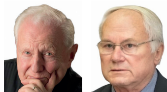
Miroslav Grégr bývalý ministr průmyslu a obchodu

Naše země se také může dostat do problémů s tlakem na společná pravidla EU pro provoz jaderných elektráren. Kdo může garantovat, jaká budou po roce 2035 nebo 2045? Budeme vůbec moci provozovat nějaké jaderné bloky? A kdy stanou v čele německé vlády Zelení a nastane proces eurounižace Energiewende včetně odchodu od jádra? Už letos nebo až za 4 roky? Společně s útlumem uhlí a tím pádem nedostupností menších elektrárenských bloků okolo 100–200 MW výkonu vhodných pro vyrovnávání dodávek do sítě jako zálohy pro obnovitelné zdroje, to povede k masivní závislosti na zemním plynu. A protože obnovitelné zdroje i při použití moderních technologií výroby a ukládání energie mají v našich přírodních podmínkách maximální potenciál cca 25% na energetickém mixu a výroba z jádra spadne hluboko pod 40% podíl, výsledek bude jednoznačný. Totální, nedobrovolná a z venku vynucená energiewendizace české ekonomiky s ještě masivnější závislostí na zemním plynu, než bude mít Německo.