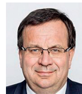
Jan Mládek bývalý ministr průmyslu a obchodu

vazby, zatáhnout železnou oponu, vyhlásit studenou válku. To už tu bylo. I kovidová pandemie ukazuje, jak je svět propojen, jak se musí spojit síly v boji proti globálnímu nebezpečí. Studená válka by významně poškodila český průmysl, české národní hospodářství, vrhla by nás na léta nazpět.