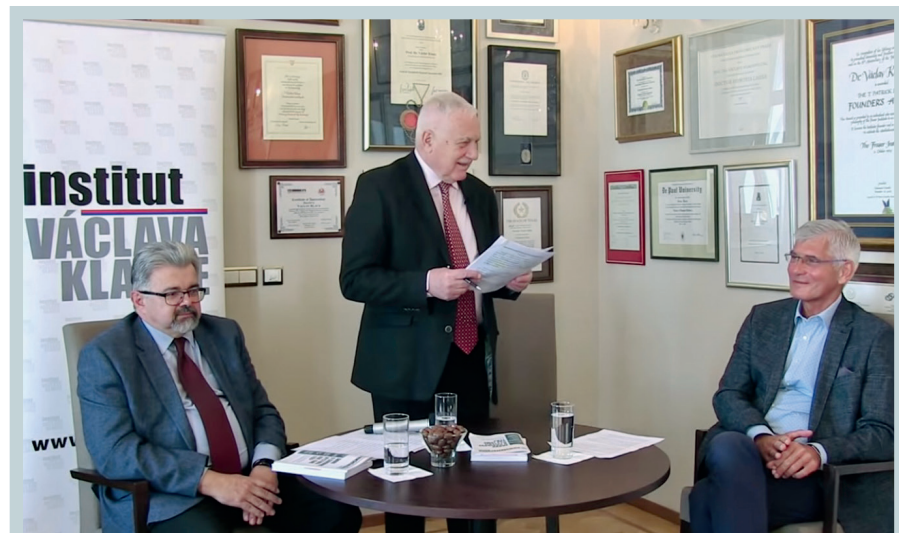
Jiří Weigl, Václav Klaus a Jiří Beran na křtu knihy Rozum proti kovidové panice a představení nového Newsletteru plus, 28. dubna 2021.