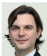
Petr Macinka Institut Václava Klause

Co s tím je otázka široce politická. Vyjmát z ní specificky cenzuru v privátních firmách je podle mne nebezpečná metodická chyba.