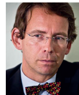
Petr Drulák politolog, Institut mezinárodních vztahů

U sociálních sítí to udělat nelze, protože stojí nad zákonem a nenesou odpovědnost za obsah. Označme tedy sociální sítě za média, žeňme je k odpovědnosti, a dejme uživatelům nástroj, díky němuž se budou moci bránit.