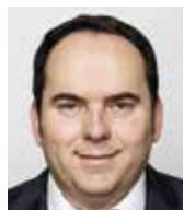
Jan Hrnčíř poslanec SPD, člen Ústavně právního výboru Sněmovny

zjistíme, že ochrana po aplikaci dvou dávek vakcíny nemůže být v ČR delší než jeden měsíc. Pravdou je to, že prodělané onemocnění COVID-19 v jakémkoliv podobě nechá mnohaletou imunitu v buněčné paměti a tak v případě prodělání nemoci není nutné se očkovat.