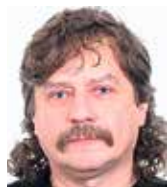
Jan Keller sociolog

Odmítnutí povinné vakcinace na Covid-19, nesmí mít za důsledek omezení základních lidských práv a svobod, a ani hospodářské, sociální a kulturní diskriminace ve smyslu Listiny základních práv a svobod. Nesmíme připustit vznik občanů dvojí kategorie očkovanych a neočkovanych proti Covid-19 s odlišnými právy a povinnostmi.