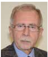
Stanislav Křeček veřejný ochránce práv

Korespondenční nebo internetové hlasování by u nás vycházelo vstříc jen pohodlnosti na hraně lenosti. Vyžadovat pro naplnění základního práva v demokratické zemi jistou minimální aktivitu v podobě dostavení se do volební místnosti je naprosto legitimní. Nemáme také stovky tisíc vojáků v zahraničí, kvůli kterým byla korespondenční volba v USA primárně zavedena. A nakonec, nejdůležitějším prvkem skutečně demokratických voleb je tajnost hlasování. A to u korespondenční či internetové volby není garantováno. Vzniká také obrovský prostor pro manipulace.