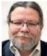
Alexandr Vondra europoslanec ODS

Nikdy jsem nebyl zastáncem korespondenčních či elektronických voleb. Lidé by si měli umět najít čas (obvykle v horizontu dvou až čtyř let) na to, aby mohli osobně a důstojně ovlivnit věci veřejné. Ne to sfouknout jedním zmáčknutím myši mezi sledováním Ordinace v růžové zahradě a objednávaním nákupu v Rohlík.cz, případně posláním dopisu. Z volby se pak stane rutina, stejně jako třeba nákup v e-shopu. Rozdíl je ovšem v tom, že nakupujeme téměř denně, ne jednou za roky a především, volbou ovlivňujeme život kolem sebe. To je, myslím, principiální věc, že se tak děje osobně a svobodně. Je to rozhodnutí, u kterého stojí za to, mu věnovat několik desítek minut. Říkal jsem to v minulosti, takže můj postoj je konzistentní. Zmatky, které nastaly a zřejmě ještě nastanou při amerických volbách, jsou pak jen dalším argumentem navíc. Jistota není ani dnes, ale tímto by se míra nejistoty zvýšila neúměrně. Chceme po každých volbách řešit jejich výsledky před soudy?