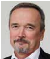
Jiří Kobza poslanec SPD

Na jednu stranu můžeme konstatovat, že korespondenční či internetové hlasování možná zjednodušuje samotný volební akt, ale současně, v nebyvale silnější intenzitě, komplikuje a degraduje celý volební proces, který má být základním konstitutivním pilířem a mechanismem demokratického režimu a vzniku politické reprezentace ve svobodné společnosti.