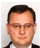
Petr Nečas bývalý premiér ČR

Ke zjednodušování volebního aktu v naší zemi není žádný důvod. Naše volební legislativa poskytuje voliči solidní „luxus“. Volby se konají ve dvou dnech, včetně jednoho víkendového. Díky centrální evidenci obyvatelstva je volič automaticky veden na volebním seznamu, a to i při změně trvalého pobytu. U celostátních voleb (sněmovních, prezidentských) má volič možnost s vystaveným voličským průkazem volit kdekoliv. V případě nemoci či nemožnosti může volič odvolit i z domova díky vyžádané návštěvě volební komise. Hustá síť volebních místností zaručuje možnost odvolit v docházkové vzdálenosti od domova.