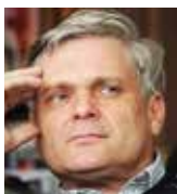
Vlastimil Tlustý bývalý ministr financí ČR

Na úkor vytvořeného bohatství i budoucnosti lze žít jen krátce. Předpokládaný stamiliardový deficit pro příští rok, i vyhlídka deficitů ve střednědobém výhledu, toto pravidlo nerespektují a pokračují tak v nastolené, nepřesvědčivě zdůvodňované a zaměřované fiskální politice. To bylo možné respektovat na počátku, ale ne dnes, kdy se peníze nedostávají k potřebným dostatečně rychle a nezřídka jsou utráceny neefektivně až nesmyslně. Ničíme si tak, čemu Němci říkají Schuldendisziplin, která má u nás dlouhodobější historii a která byla vložena i do základů naší transformace po pádu komunismu.