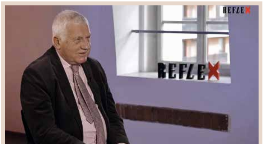
Václav Klaus byl hostem pořadu časopisu Reflex – Prostor X . S moderátorem Čestmírem Strakatým hovořil o politickém přístupu k současné covidové epidemii, o stavu ekonomiky, ale i o proběhlých krajských a senátních volbách.

Dnes při emisích státních dluhopisů to vypadá, že dluh a stav veřejných financí nehraje roli. Situace se ale rychle může změnit. Na trh si i v dalších letech půjde půjčit většina zemí a investoři budou čím dál více zohledňovat skutečnou ekonomickou realitu a stav financí. V malé otevřené ekonomice, s mělkým finančním trhem, v níž podíl zahraničních držitelů našeho dluhu roste, se může rychle stát z čehokoliv dnes zdánlivě neškodného prvek vysoké nestability. ■