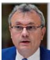
Vladimír Dlouhý prezident Hospodářské komory

Stávající balík pomoci v kombinaci s přísným ozdravným programem je solidním základem pro odvrácení odchodu Řecka z měnové unie a zároveň maximem toho, na čem jsou dnes schopny členové eurozóny, potažmo EU, vůči Řecku nalézt shodu. Pokud Řekové nedostojí svým závazkům, čekalo by nás pravděpodobně opakování celého krizového scénáře, jen s vážnějšími důsledky ekonomickými, bezpečnostními i geopolitickými. Největší vliv na to, zda dohoda znamená průlom nebo prohloubení agónie eurozóny, má nyní Řecko samo.