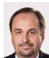
Jan Kohout bývalý ministr zahraničí ČR

Za takové situace tvrdá linie vůči Íránu, sankce a bojkot íránské ropy znamenají, že ve sporu, který je primárně náboženský, se přidáváme na jednu stranu, a sice tu pro nás nebezpečnější. Jak ten paradox vysvětlit? Kromě nákupu ropy a z druhé strany zbraní se málo mluví o provázanosti elit, byť se každou chvílí nějak ukáže. Saúdští princové zabíjejí nudu v drahých nemovitostech v Londýně; když Windsorové hasili krizi kolem Harryho a Meghan, princ Charles se musel urychleně vrátit z Rijádu. Končící leonardovská výstava v Louvre nakonec nebyla tak oslnivá i proto, že mistrův obraz Salvatore Mundi zůstal na jachtě jakéhosi saúdského majitele atd. atp.