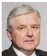
Jiří Rusnok guvernér ČNB

Bezhotovostní peněžní oběh (či společnost) stále více proniká do našich každodenních životů. Jako uživatel tyto novinky vítám, protože mi většinou usnadňují způsob placení a zvyšují můj spotřebitelský komfort.