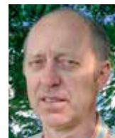
Aleš Valenta Institut Václava Klause

od řady jiných evropských států a bez ohledu na dnešní snahy o relativizaci našich dějin, z mnoha důvodů právem hrdí.