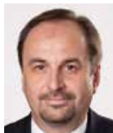
Jan Kohout bývalý ministr zahraničí

Mnichov 1938 byl vyústěním mnoha příčin, mezi nimiž tzv. zrada západních mocností – Anglie a Francie – hrála jednu z klíčových rolí. Zrada je především kategorií etickou, v případě Mnichova se silným emocionálním nábojem, vzhledem i k tomu, co následovalo. Západní mocnosti však nikdy autentický a strategický zájem o střední Evropu nejevily a potichu respektovaly dominanci Německa v tomto prostoru. Na tomto přístupu, hluboce zakořeněném v hlavách britských i francouzských elit, se bohužel nic nezměnilo ani dnes. Proněmecké až pronacistické postoje britské šlechty před 2. světovou válkou jsou dostatečně známy a bohužel něco z nich, alespoň v pohledu na předválečné Československo přezívá dodnes, byť pod nánosem mnoha slov o spojenectví.