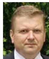
Radovan Vích poslanec SPD

Dnes, se znalostí následků Mnichova už víme. Bránit jsme se měli. Zradili jsme především sami sebe. A pak znovu a opakovaně: 1938 (2. republika s hanobením demokracie, protizidovskými opatřeními, vytvářením autoritativního režimu), 1946 (volební vítězství komunistů), 1948 (nastolení totality zdánlivě ústavní cestou, selhání demokratických politiků, minimální odpor proti nástupu komunistů k moci), 1969 (definitivní potlačení pražského jara vlastními politiky, armádou a policií).