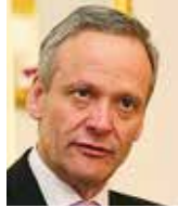
Cyril Svoboda bývalý ministr zahraničí

Zásadní potíž tohoto neblahého historického dědictví však tkví v tom, že mnichovským šokem v genech trpíme tak či onak všichni a k tomu dodnes. Protože co jiného je permanentní česká nechť k přímé akci a nahrazování pravdy o sobě zpravidla jalovými výmluvami na mnohem mocnější a nepřekonatelné tlaky zvenku?