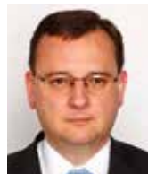
Petr Nečas bývalý premiér ČR

Poučení z této smutné historie je jedno – velmoci nemají přátele, ale pouze své zájmy. Je dobré to vědět, počítat s tím a nežít v iluzi, že někdo jiný než my sami, může zajistit naši budoucnost.