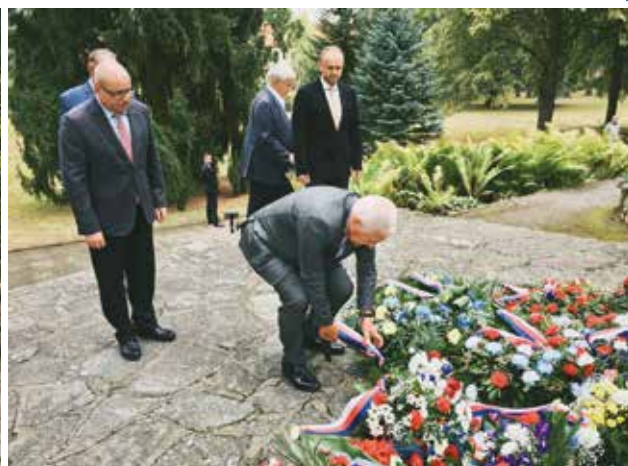
Václav Klaus se při své zájmové návštěvě Táborstva v Sezimově Ústí poklonil památce jednoho ze zakladatelů státu prezidenta Dr. Edvarda Beneše u příležitosti 70. výročí jeho úmrtí. (3. 9. 2018)